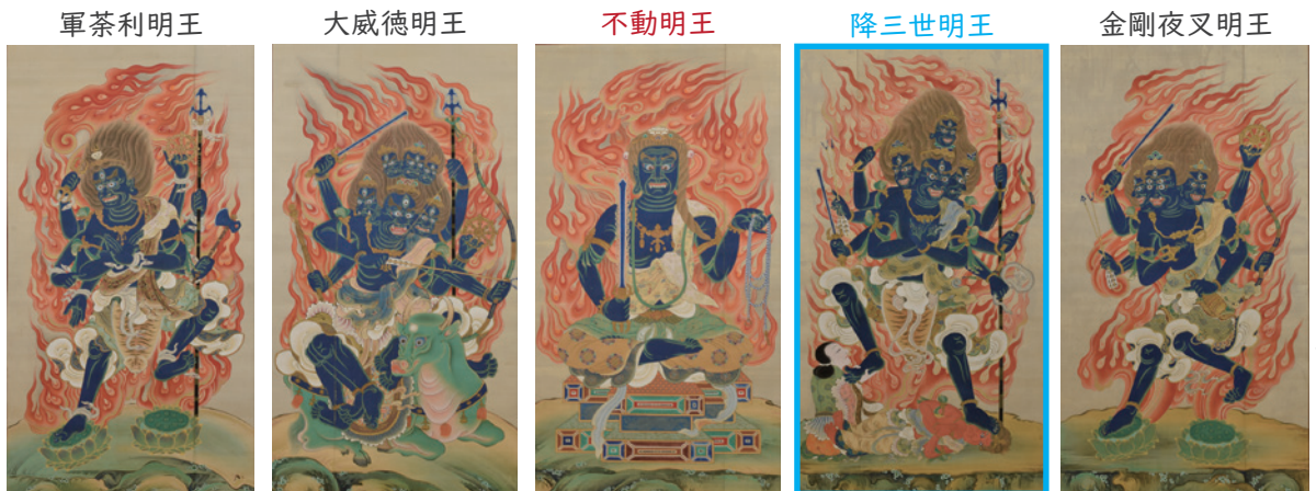
五大明王像 本館蔵

明王は一般的に、忿怒の相で火炎を背負い、髪は怒りで逆立ち、武器類を手に持つ…など、見た目にもこわ〜い特徴がありますが、中でも、不動明王の次に格が高いとされる降三世明王の怖さは…別格です！足元を見ると、ナント誰かを踏みつけてにしています！？さて問題です。降三世明王が踏みつけているのは、一体誰？でしょうか？