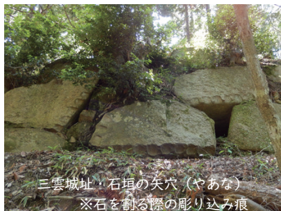
三雲城址・石垣の矢穴（やあな） ※石を割る際の彫り込み痕

🔍 おススメ外部リンク：(公財) 滋賀県文化財保護協会 調査員のおすすめの逸品 No.285 割られた石材・割られなかった石材