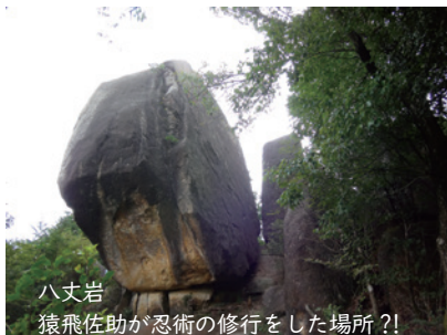
八丈岩 猿飛佐助が忍術の修行をした場所?!