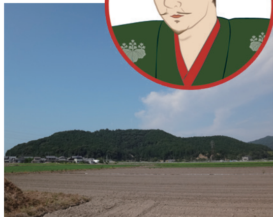
(安土山・近江八幡市)