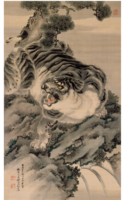
巖上吃哮猛虎図 岸岱筆 本館蔵

江戸中・後期に活動した絵師の岸駒 がんく は、特にリアルな虎 とら を描いたことで知られています。当館が所蔵する巖上吃哮猛虎図 がんじょうほうこうもうこず は、岸駒の長男である岸岱 がんだい が描いた作品で、滝水の流れる険しい岩 けわ の上で、身体をひねりながら猛々しく吠える虎が、力強く描かれています。では、問題です。画技の指導にも厳しかった父・岸駒が、リアルな虎を描くために、した事とはいったい何だったのでしょうか？次の中から選んでください。