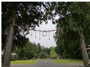
日野町・馬見岡綿向神社