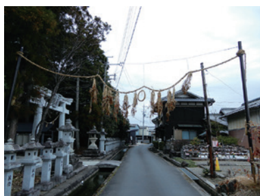
東近江市・玉緒神社

滋賀県には、昔から伝わる多くの風習があります。こちらの写真もその一つ。神社の参道や集落の入口に張られた縄には意味があります。悪霊や疫病など悪さをするものが神聖な地域に入り込まないようにして、安全や五穀豊穡が願われています。その形状は、地域によって様々ですが、県内でよく見られるのは、藁でつくった大きな縄の中央に円い輪を掛けて、小枝を吊るすタイプです。では問題です。年頭に新しく張り替えられる、これらの“モノ”を何というのでしょうか？