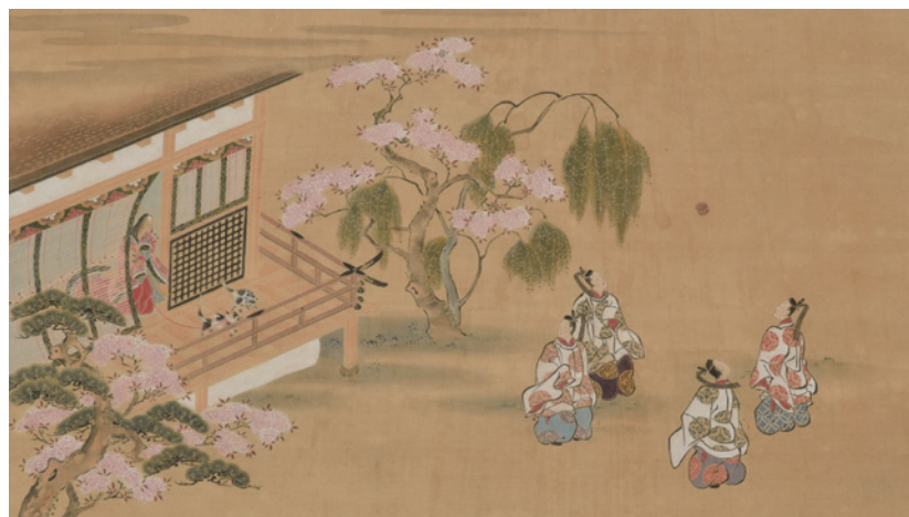
友禅蹴鞠図 本館蔵