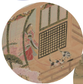
友禅蹴鞠図(部分) 作者不詳(本館蔵)

源氏ファンの方ならずすでにお分かりかと思いますが、これは源氏物語の「若菜」巻の一場面。光源氏の兄である朱雀院の娘で、光源氏の正妻となった女三宮と、光源氏の親友・頭の中將の長男・柏木との衝撃的な出逢いの場面を描いたものです。紐をつけられた猫が他の猫を追いかけて走り出したため御簾が引かれ、そのすき間から女三宮が姿を見せます。高く蹴り上げられた蹴鞠を追う公達の中で、一人振り返って女三宮を見つめるのが柏木です。密かに見つめ合う二人・・・まるで昼ドラのような展開です。本図の作者は不明ですが、全54帖からなる源氏物語の中で、この場面を描き上げるとは・・・なかなか意味深。。