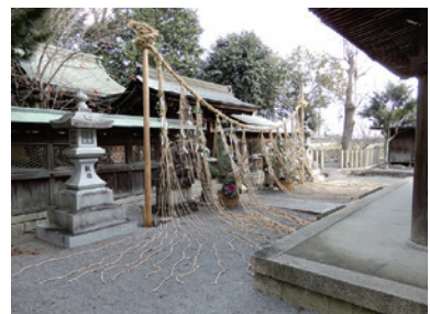
甲賀市・総社神社