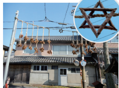
東近江市蒲生大森町