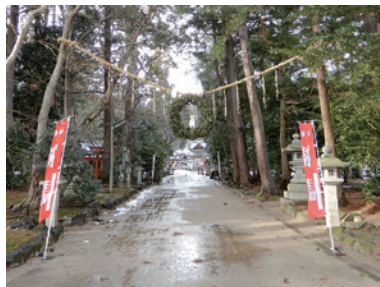
近江八幡市・奥石神社