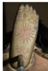
重要文化財 木造阿弥陀如来立像 観音寺（草津市）