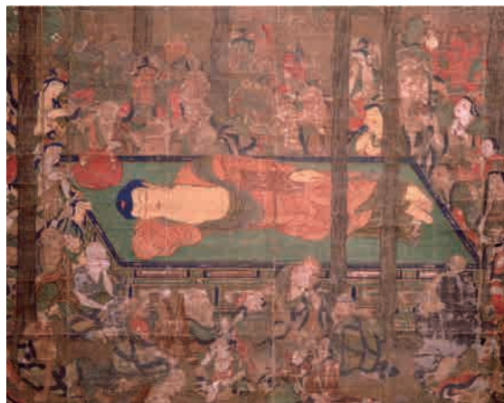
仏涅槃図 荒戸神社（大津市）「部分」