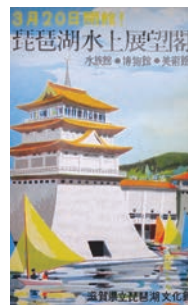
開館告知パンフレット