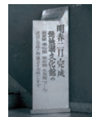
琵琶湖文化館建設募金箱