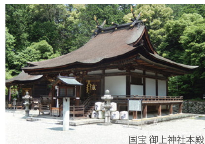
国宝 御上神社本殿