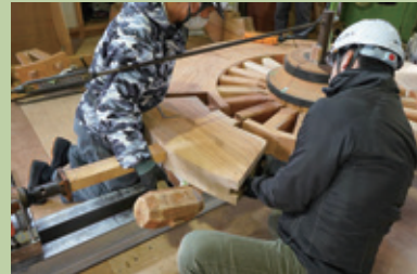
大津祭の曳山車輪修理の様子

近年、身近な存在である民俗文化財の保存や修理が話題になりつつあります。とくに総合芸術とも呼ぶべき曳山の山車については、幕・金具・車輪など各部の修理にあたってさまざまな工芸技術を結集して行います。大津、長浜、日野、水口の曳山修理を紹介する映像番組を中心に、知られざる修理の世界に迫ります。