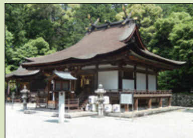
国宝 御上神社本殿

野洲市歴史民俗博物館[銅鐸博物館]で秋に開催される地域連携企画展に関連し、野洲市内の寺社仏閣を巡ります。近江を代表する名山三上山の神を祀る御上神社や、普段は非公開の仏像などを拝観します。【詳細は9月15日まで秘密です】