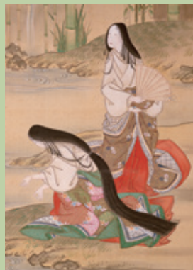
十二月図屏風【七夕部分】 月岡雪鼎筆 (琵琶湖文化館蔵)

近世絵画には様々な季節の表現や古来行われてきた年中行事など、多彩な四季が表されてきました。四季の表現にまつわる収蔵品の意外な見どころとともに、その魅力をお話します。今年度冬季に県立安土城考古博物館で開催する、同テーマの地域連携企画展もご紹介します。