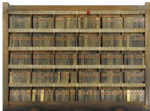
活版印刷資料 (字母)