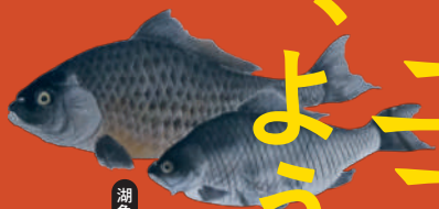
湖魚図(部分) 吉田虎之助筆