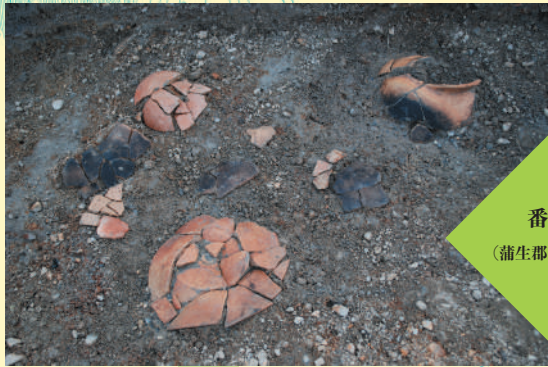
番場遺跡 (蒲生郡日野町三十坪)