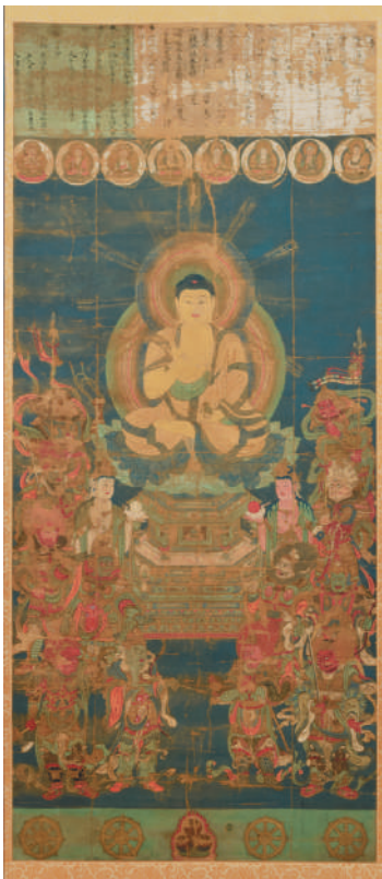
△ 薬師十二神将像 (新宮神社蔵) 【後期展示】 修理後