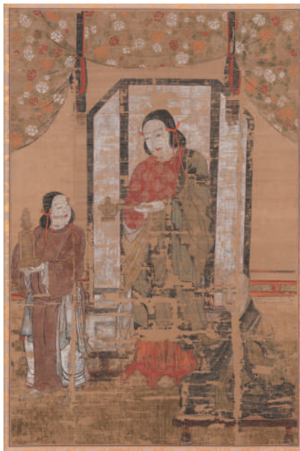
聖徳太子二臣像 (長命寺蔵) 【後期展示】 修理後

最新の情報は当館のホームページにてご確認ください。 https://www.azuchi-museum.or.jp