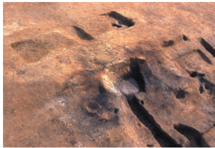
鍛冶屋敷遺跡 溶解炉