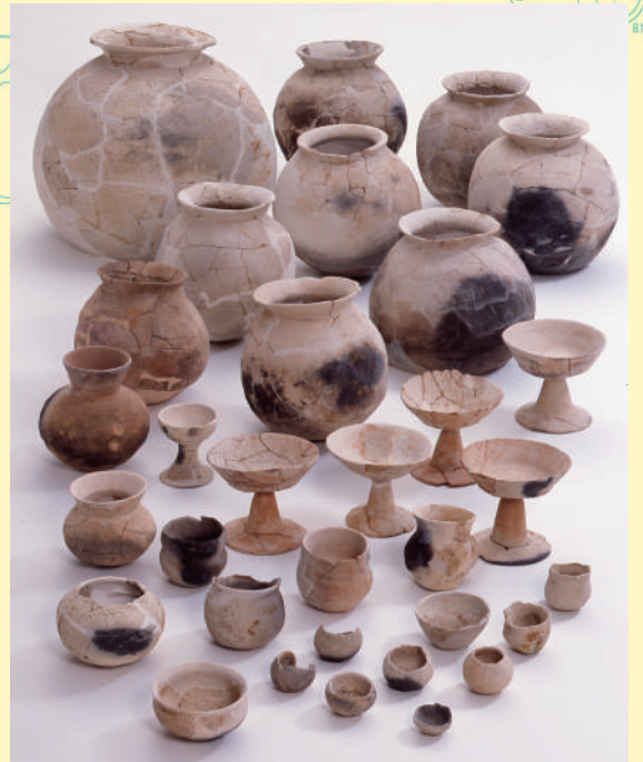
落込みから出土した土器 (滋賀県蔵)