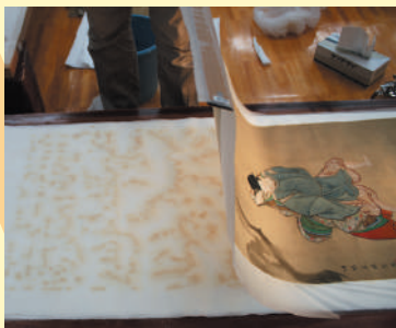
湿式クリーニング