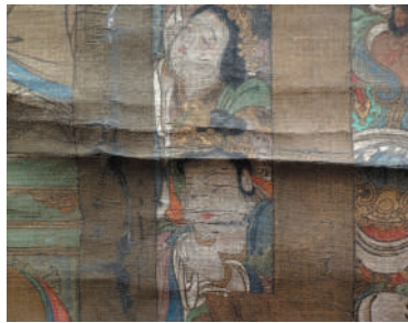
□ 仏涅槃図 (西明寺蔵) 【前期展示】 修理前部分