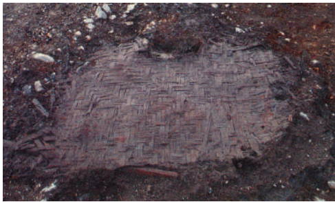
番場遺跡 網代